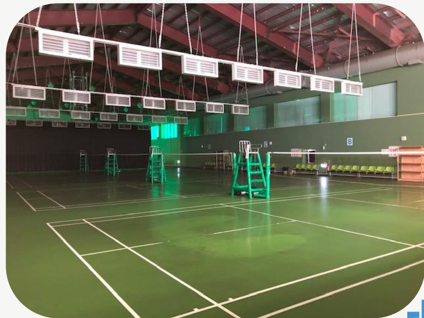
羽球場 排球場 籃球場